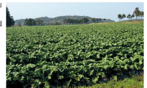
土井ヶ浜農園風景